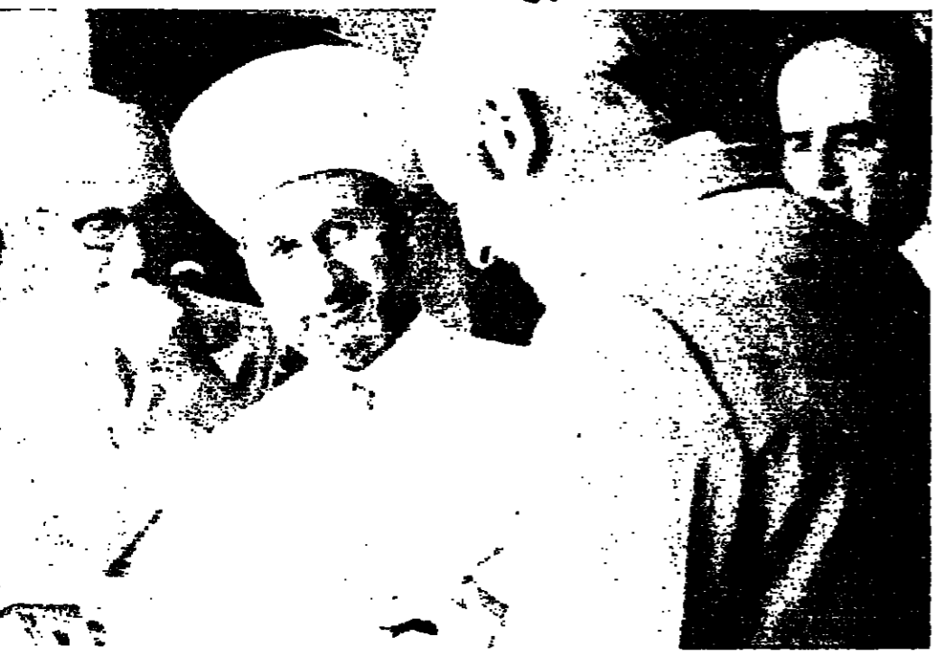
ساحة مفتي الجمهورية الشيخ خالد بجلي بتصرحه في القصر الجمهوري

كنا ان اللحل كبير ايضا بان تكون هذه الاحداث التي مرونا بها اخر ما نراه من نوعها ، وان يعود لبنان الى سابق عهده ، لبنان الحية ولبنان التعاون ، ولبنان العزيز المحب للجميع والمناضل عن المبادئ الخيرة والخيرى لكل حق ولكل عدل . عرب ساحة مفتي الجمهورية الشيخ خالد ، في هذه المقامات التي تقضي ان تزور مخيمته ونظارته معه في القضايا الهامة التي هي مطروحة على ساحة السياسة اللبنانية ، وقد تمتعنا فترة طويلة في الحديث الكبير والنفس الطيبة العريضة على مصلحة لبنان واللبنانيين جميعا ، واملنا كبير بان يبدل الله سبحانه وتعالى خوف لبنان واضطرابه الى هدوء واتزان يقبل الحكام والمنسيبين التعاون مع فخامته ،